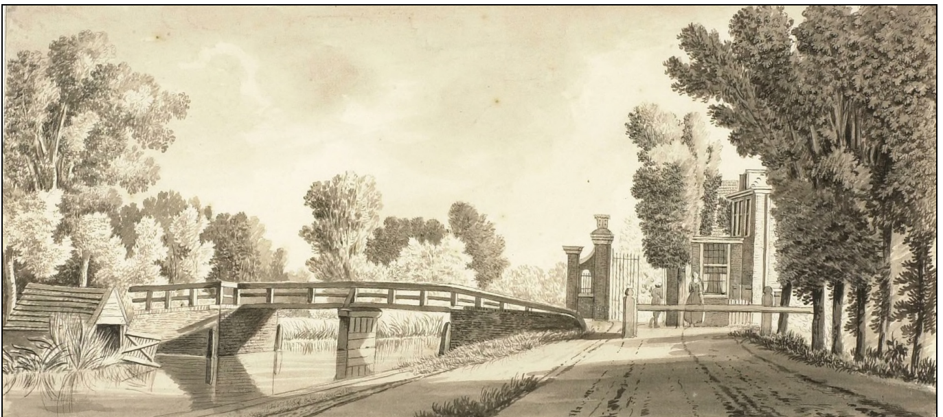
Tolhek tweede brug bij de Aardenhoutslaan (Zandvoortselaan)