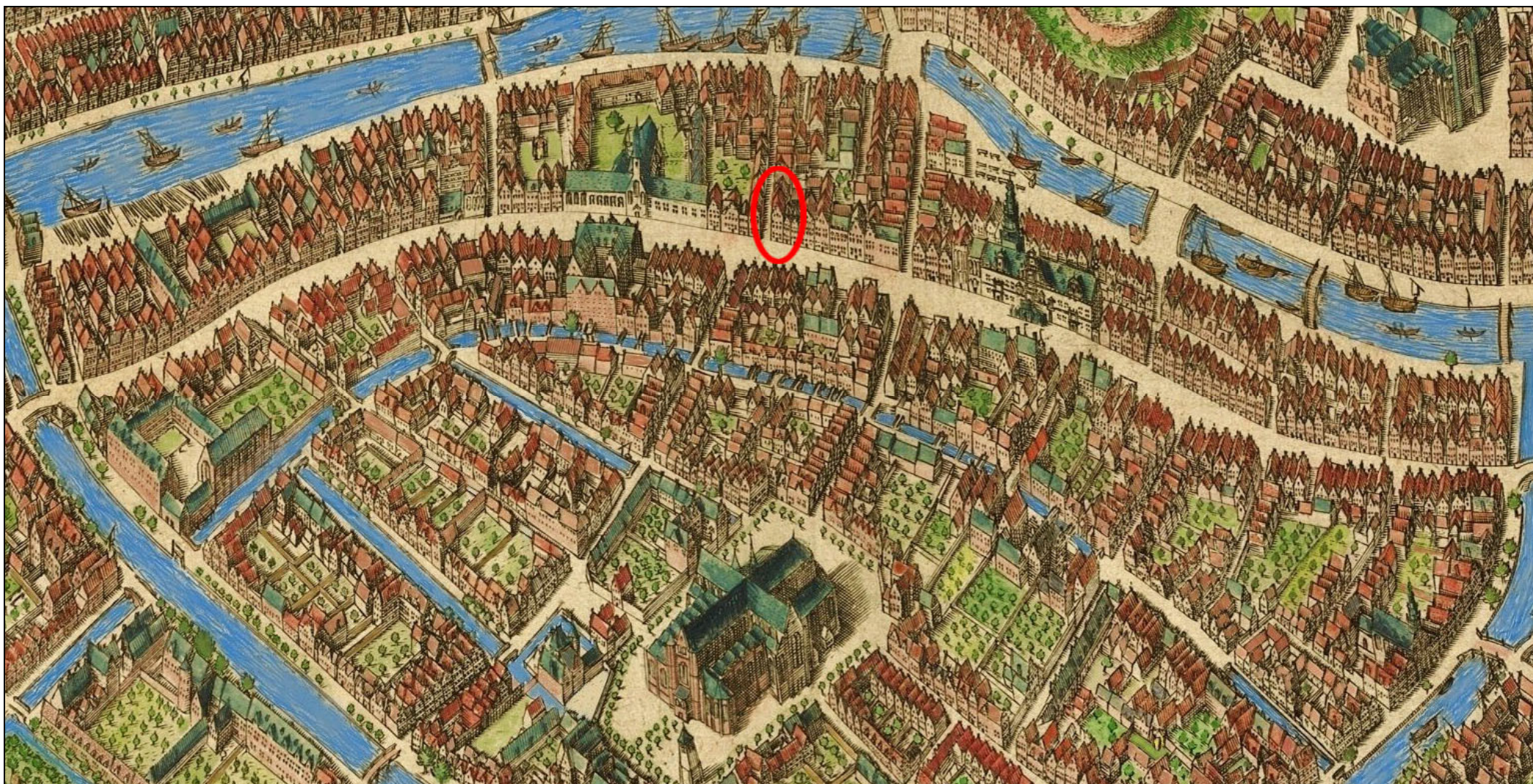
Herberg de Vechtende Leeu, kaart van Pieter Bast uit 1600 (omcirkeld, Breestraat 76, hoek Mandenmakerssteeg)