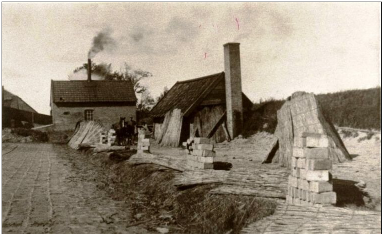
Steenbakkerij de Erven Daandels Hattem