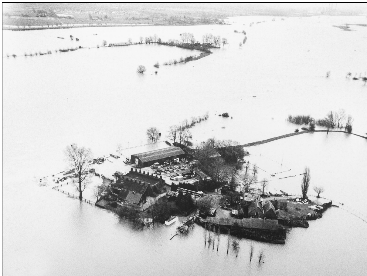
Steenbakkerij de Erven Daandels Hattem