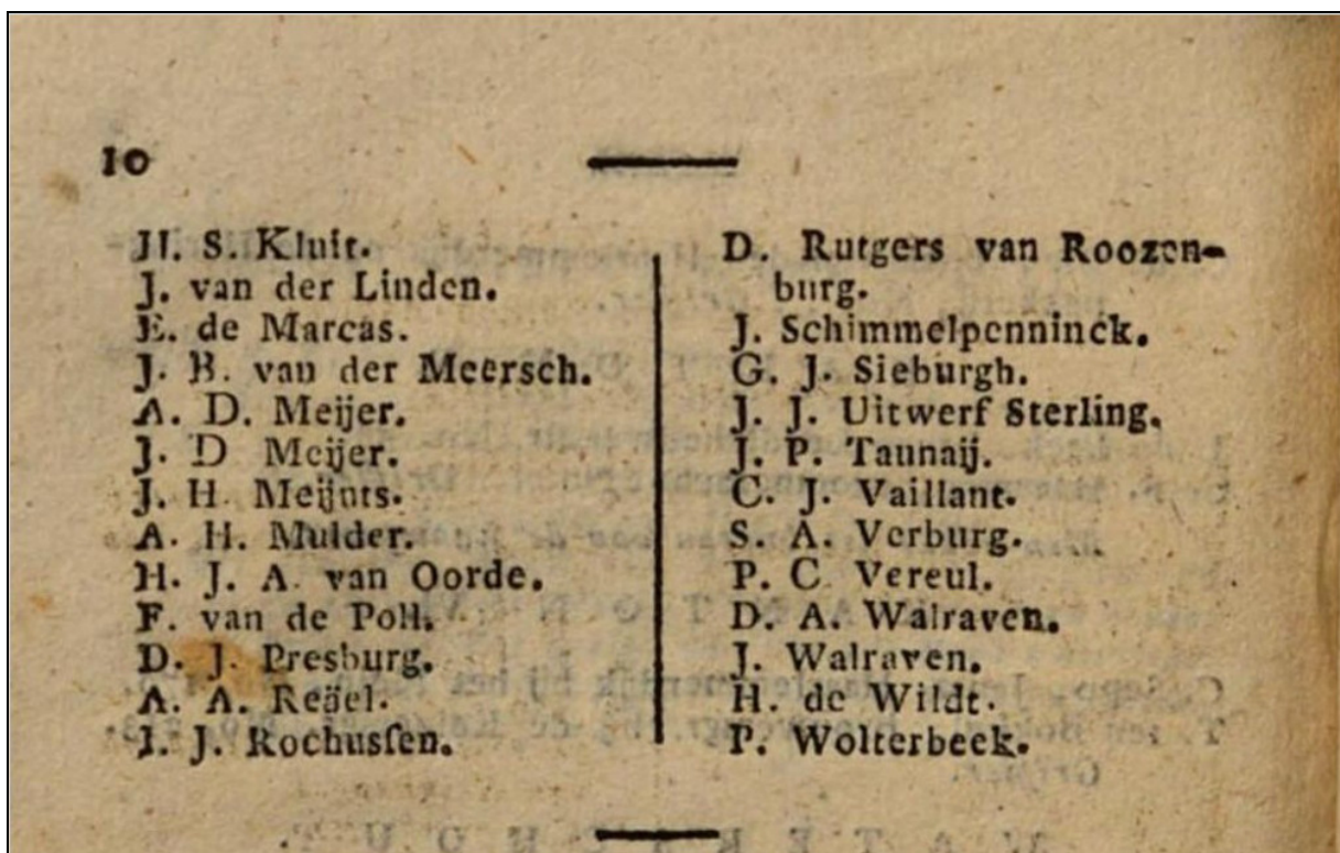
Algemeen - adresboek der stad Amsterdam of Almanak voor den jare 1820, pagina 9 en 10 (Google books)